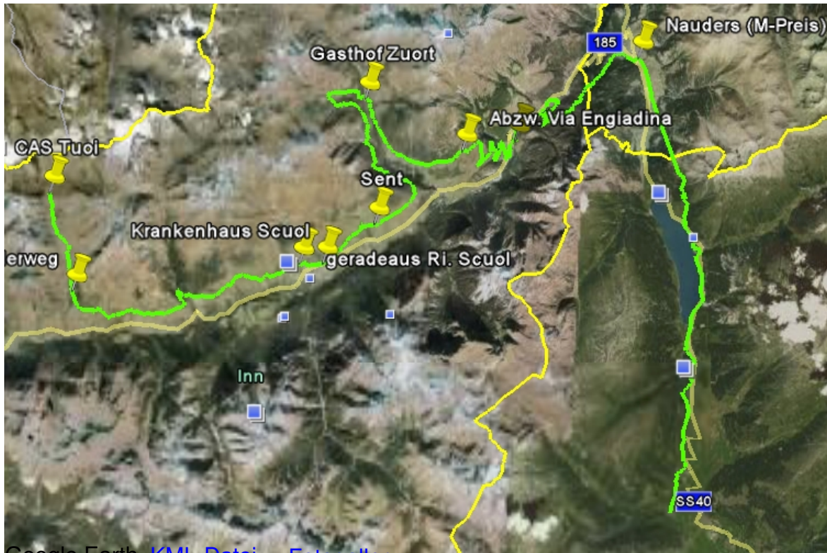
Google Earth KML-Datei - Fotogallery