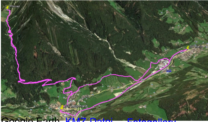
Google Earth KMZ-Datei - Fotogallery