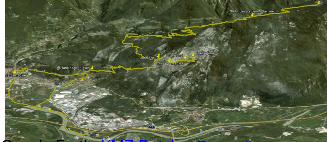
Google Earth KMZ-Datei - Fotogalerie